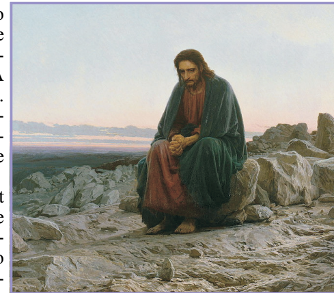
Ivan Nikolaevič Kramskoy: Isus u pustinji

Ovdje se zapravo stavlja na provjeru jedno temeljno pitanje iz kojeg izrasta cijeli odnos prema Bogu, odnosno provjerava se čovjekov odgovor na pitanje koje određuje taj odnos. A pitanje bi se moglo formulirati ovako: Preuzimam li ja odgovornost za sebe samoga koju je Bog stavio u moje ruke svijesno,